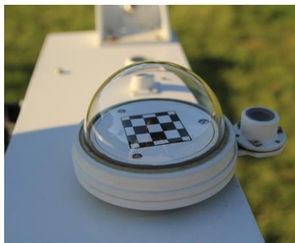
Рисунок 11 – Размещение на следящей системе актинометра (слева) и пиранометра (справа)

При правильной работе следящей системы световое пятно, создаваемое солнечным лучом на фланце актинометра, не должно быть смещено относительно черной марки более чем на 1 мм, а пиранометр должен полностью затеняться экраном;