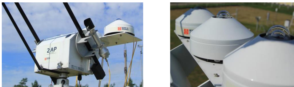
Рисунок 10 – Размещение на следящей системе пиргелиометра (слева), пиранометров и пиргеометра (справа)

б) проверить срабатывание следящей системы и правильность нацеливания пиргелиометра, правильность затенения экранами пиранометра и пиргеометра (рисунок 10).